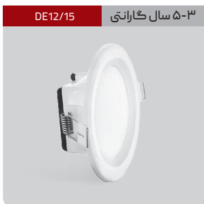
DE12/15 ۳-۵ سال گارانتی