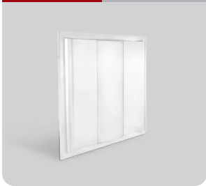
OA12/14 ۵ سال گارانتی