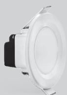
DE61/63 ۵ سال گارانتی