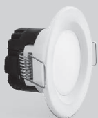
DE05/07 ۵ سال گارانتی