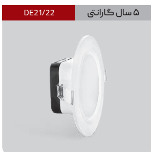
DE21/22 ۵ سال گارانتی