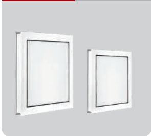
TB11/21 ۳ سال گارانتی