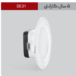
DE31 ۵ سال گارانتی