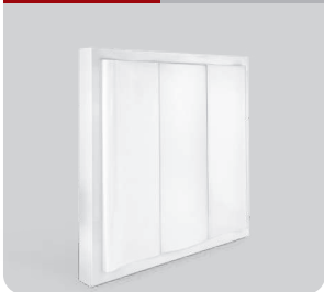
OA22/24 ۵ سال گارانتی