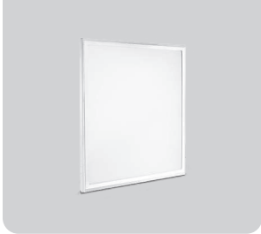
OR21/24 ۵ سال گارانتی