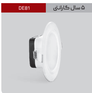
DE81 ۵ سال گارانتی